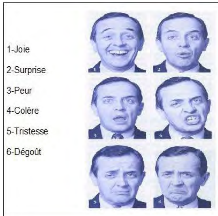
Fig. 1 : Représentation des six émotions 40